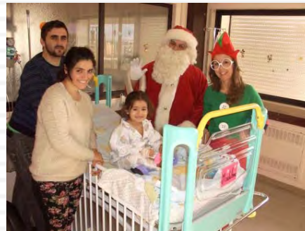
Pai Natal do Fórum Montijo anima meninos na Pediatria