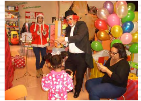
Uma manhã diferente na Pediatria com o projeto “Saúde Brincando” do Rotary Club do Barreiro