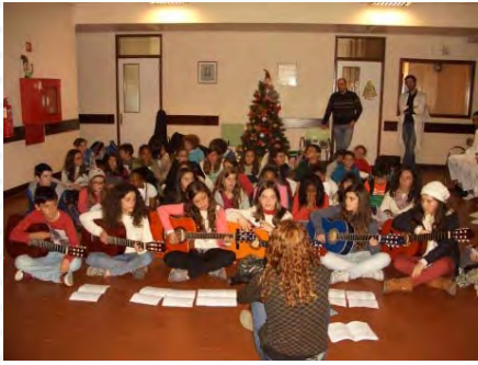
Escolas Básicas 2/3 da Quinta da Lomba, da Quinta Nova da Telha e Padre Abílio Mendes animam doentes internados na Psiquiatria