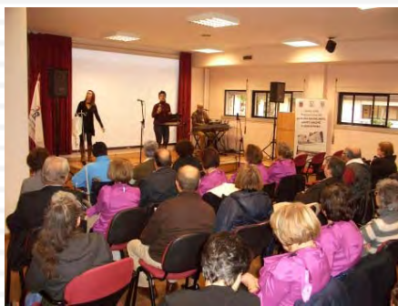
Festa de Natal dos doentes, com a participação do Grupo “Companhia Limitada” e 4 coros da União de Freguesias do Alto do Seixalinho, Verderena e Santo André