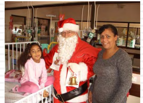
Pai Natal da União de Freguesias do Alto do Seixalinho, Verderena e Santo André visita crianças internadas